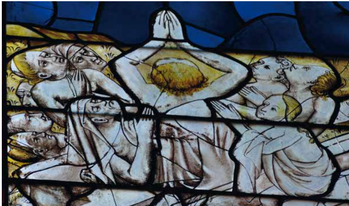
La résurrection des corps (XV e s.), cathédrale de Rodez.

Si les Romains utilisaient des verres opaques pour fermer les ouvertures de leurs maisons, le vitrail coloré fait son apparition à l'époque mérovingienne dans les édifices chrétiens. Assemblage de pièces de verre reliées par des baguettes de plomb, il se développe au XII e siècle avec l'essor de l'architecture religieuse. Au XIII e siècle, plus